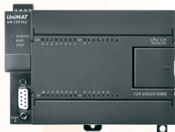
Модули UniMAT S7-200