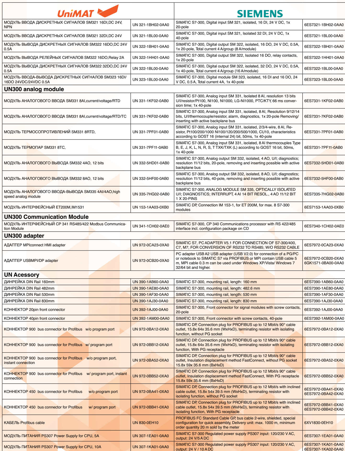
Таблица замены модулей Siemens S7-300 на модули UniMAT

ООО Промэнерго Автоматика – официальный дистрибьютор UniMAT в России. Весь спектр продукции UniMAT в наличии на складе в Москве и регионах!