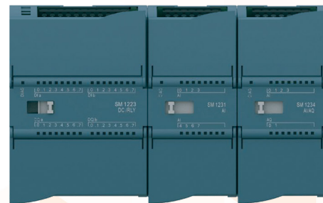
Модули UniMAT S7-1200

UniMAT — ведущий китайский производитель оборудования для промышленной автоматизации. С 2005 года компания разрабатывает и производит программируемые логические контроллеры и HMI панели высочайшего качества для большинства сфер применения.