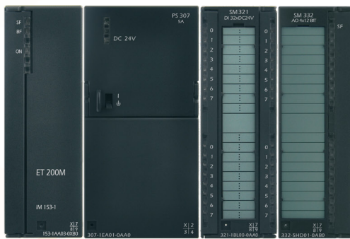
Модули UniMAT S7-300